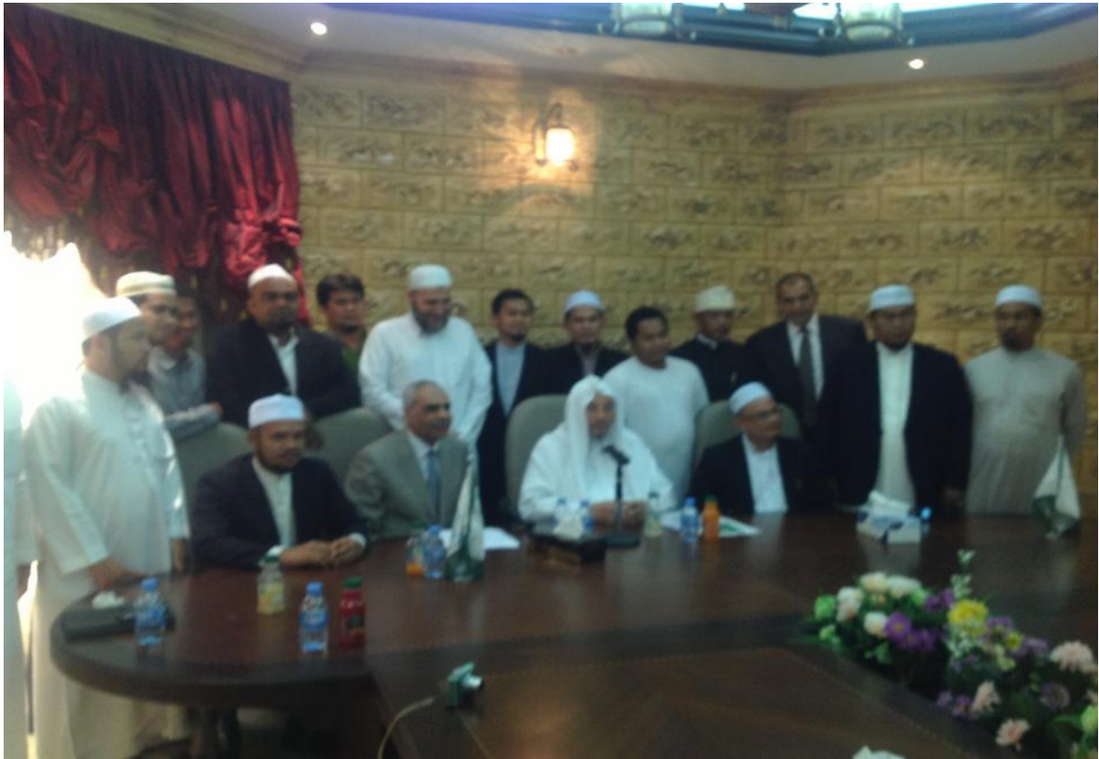
ถ่ายภาพพร้อมกับซัยค์อัลก็อรฎอวีย์